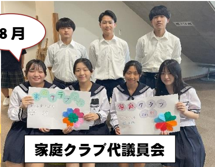
家庭クラブ代議員会