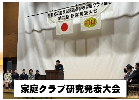
家庭クラブ研究発表大会