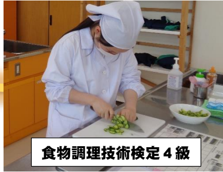
食物調理技術検定 4級