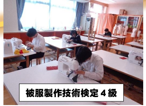
被服製作技術検定 4級