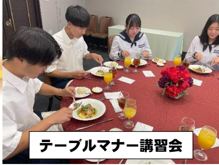
テーブルマナー講習会