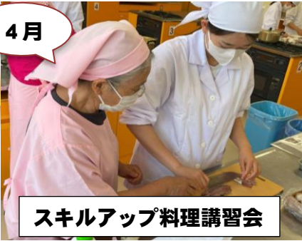
スキルアップ料理講習会