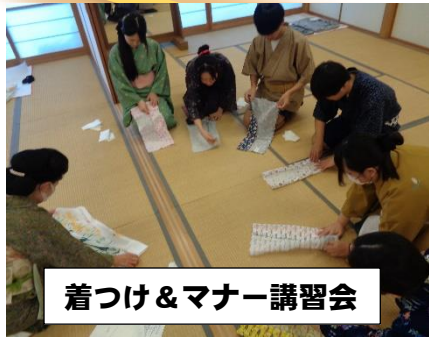
着つけ&マナー講習会