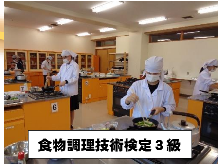
食物調理技術検定 3級