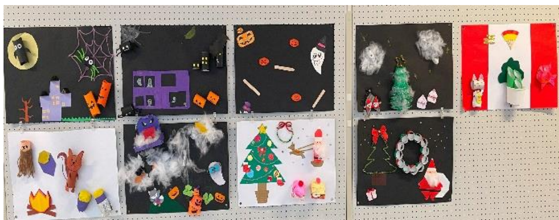
壁面画を廃材を使って作りました。テーマは秋🍁・冬❄️