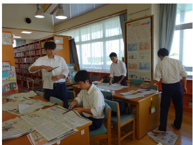
図書委員会【社説切り抜きファイルの作成中です！】

人間関係(友だちとのつきあい)に疲れていませんか？ 心のもやもやを読書で解決！ 自分を見つめ直してみましよう。 図書館は朝8時には開館しています。