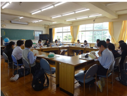
グループごとの読書会

NDCに関わらず、「新着図書コーナー」に配架してあります。どんな本が入ったか、お楽しみに!