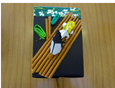
超絶技巧のペン立て