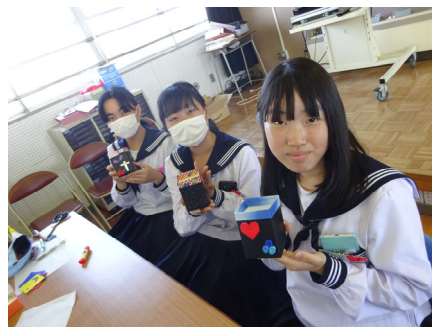
午後の研修(ペン立て作り)

6月12日(水)鹿島灘高校において、県東地区生徒図書委員会が開催され、本校では3名の図書委員が参加してきました。県東地区13校(私学を含む)が集まり、3つの分科会で『読書会』を行い、午後は図書館で活用できる「ペン立て作り」をしてきました。他校生と意見を述べ合うという事は、参加者全てがはじめての経験だったと思います。どのグループも活気ある読書会になりました。