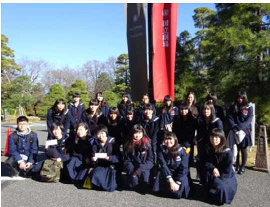
国立劇場前にて 12月9日