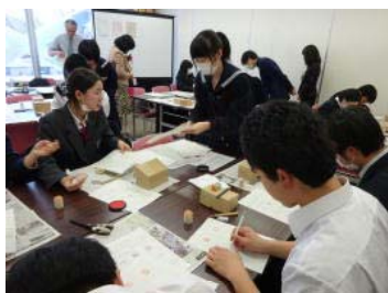
少し緊張しながら篆刻の指導中!