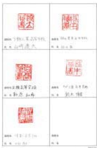
できあった蔵書印 記念にグループごとに押ししてもらいました。