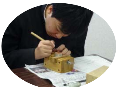
真剣に作業に取り組む参加者