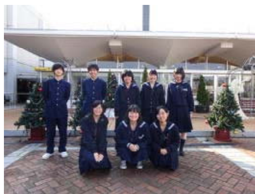
参加した8名の図書委員さん