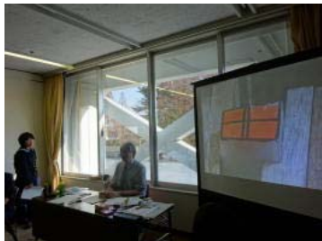
実物投影機を使って手順を説明中!

図書委員のミッションについて、同じ高校生がクイズ形式などをつかってわかりやすい説明をしてくれました。とても楽しく、また、参考になりました。ビブリオバトルは各々本のおもしろさをユニークに発表していて、どの本も読んでみたいと思いました。